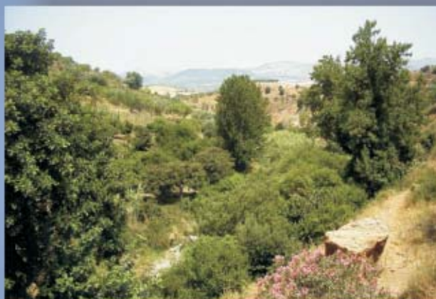
Alamos Blancos, Ruta del Río