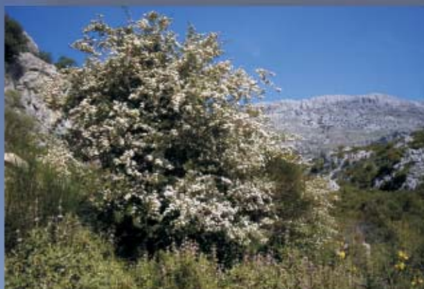
Espino Majoleto, Ruta de la Sierra

No olvidaremos en este itinerario el gran valor ecológico que posee la ruta. Observaremos sierras, con bosque mediterráneo, resaltando de su fauna rica y variada la cabra montés, alguna que otra águila perdicera, zorro, jineta, perdiz roja, conejo, liebre, ... Las especies arbóreas que crecen, suelen ser de hoja perenne, pequeña y coriácea para soportar mejor las sequías estivales: encina, alcornoque y espinos majoleto, acompañados de acebuches, quejigos, algarrobos, etc. son los principales árboles que podemos encontrar. En el suelo proliferan las plantas aromáticas como romeros, salvias, lavanda o cantueso, lentisco, jara, etc.