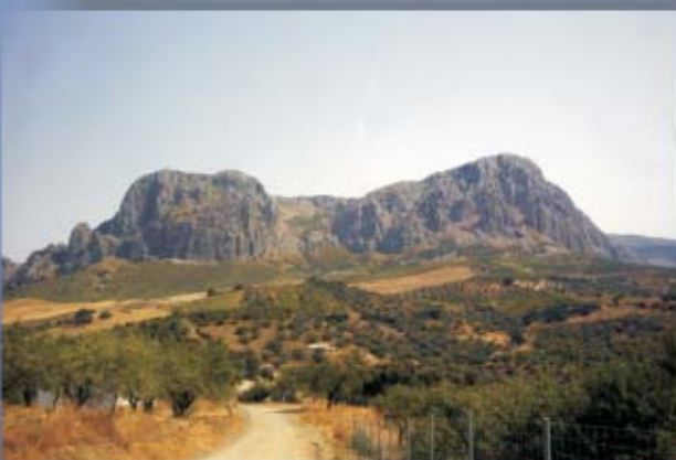
Tajos Gomer y Doña Ana, Ruta de los Tajos